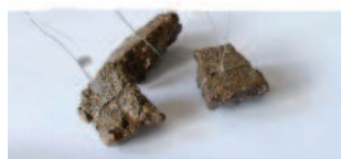
Análisis de compactación