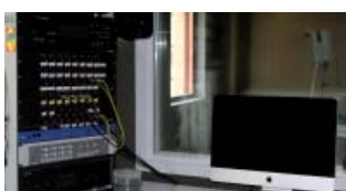
Estudio de Grabación