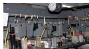
Laboratorio Químico de Fotografía.