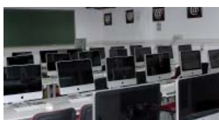
Sala de Edición