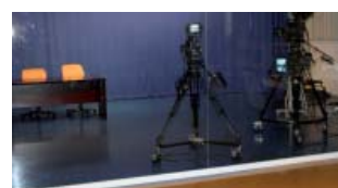
Plató de Televisión