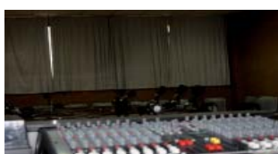
Estudio de Radio