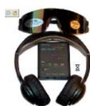
Equipo de Entrenamiento Audiovisual