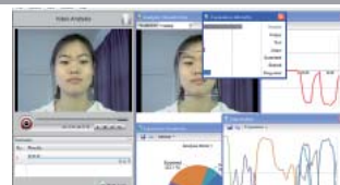
Face Reader 4.0: Evaluación y Análisis de expresiones faciales