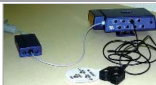
Polígrafo portátil de 8 canales ProComp Infinity