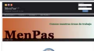
Evaluación psicosocial on-line: Menpas